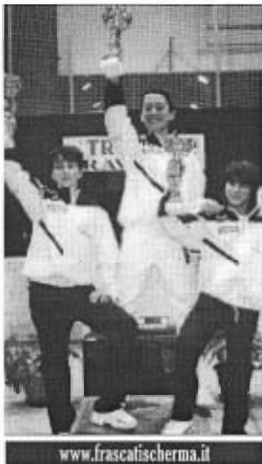
Ottima anche la prova delle bambine, settime